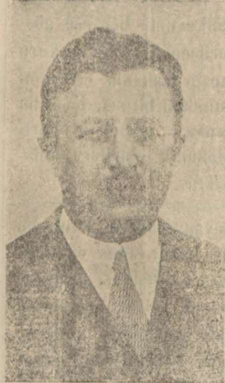
Dahiliye Vekili Şükrü Kaya Bey

Kürsüye gelen Şükrü Kaya Bey Türkiye'ye olan muhacireti ve sebeplerini izah ederek 923 ten 933 e kadar mubadil ve sair muhacirlerin sayısını ve bunlara verilen bono miktarının 6 milyon lira tuttuğunu ve ondan sonra 1 Haziran 1934 te kadar gelen muhacirlerin 3018 evde 15319 nüfus olduğunu bunların nerelerden geldiklerini ve hangi muntakaya iskân